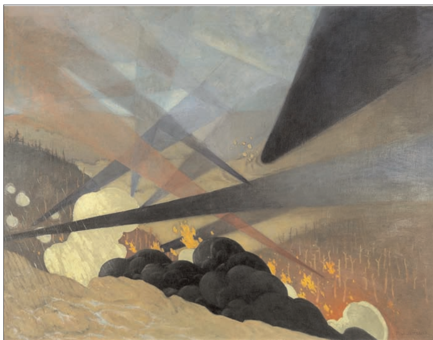
Verdun, tableau de guerre interprété, projections colorées noires, bleues et rouges, terrains dévastés, nuées de gaz. Félix Vallotton (1865-1925). Huile sur toile, 1917, (114x146 cm). Inv. 21889 ; Eb 1518

Représentant un paysage dévasté par les forces naturelles et la puissance destructrice de la guerre, ce tableau illustre la bataille de Verdun qui s'est déroulée de février à décembre 1916. Aucun élément du paysage ne nous permet de reconnaître un site particulier. Seuls quelques arbres brûlés, éléments traditionnels dans les représentations de champ de bataille, sont identifiables. Les forces «industrielle» et «naturelle» conjuguent leurs effets destructeurs : la pluie, les nuages de gaz, les éclats d'obus colorés de vert, de rouge, de bleu se mêlent et se superposent pour composer ce paysage d'apocalypse. L'« enfer de Verdun », si souvent évoqué par les poilus à leur retour du front, prend une consistance et une force rarement atteinte par une peinture. Mais où sont les combats et les soldats ? Ici, la guerre n'est pas vue