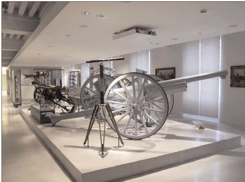
Plateau d'armes, salle Alsace-Lorraine.

Le canon de 75 mm, conçu en 1897, est considéré comme le meilleur canon de campagne de son époque. Élaboré dans le contexte de la «Revanche», il est emblématique de la Première Guerre mondiale. Son avance technologique lui permet de commencer sa carrière en Chine en 1900 et de la terminer en Algérie, 60 ans plus tard.