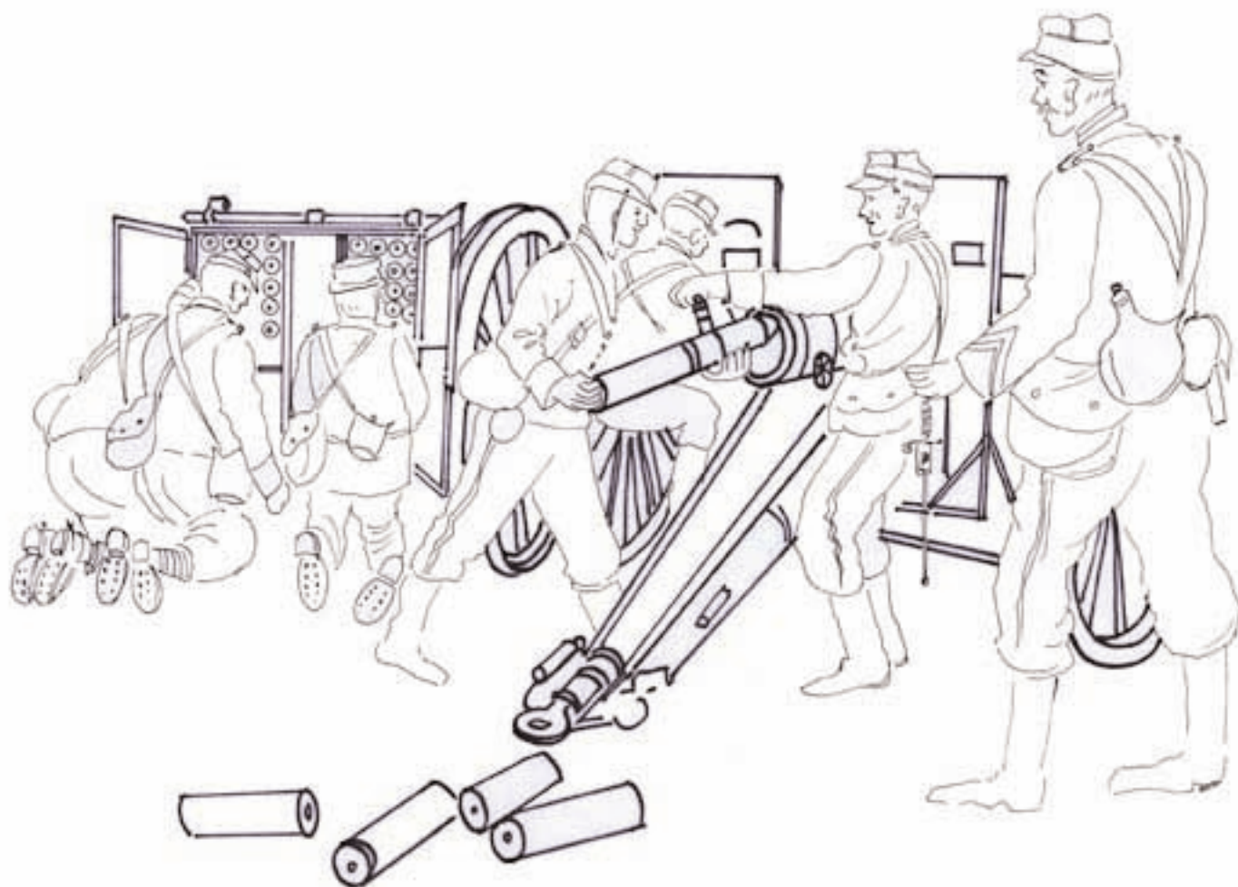
Le chargement du canon de 75, dessin Claude Banar © Musée de l'Armée.

Après la Grande Guerre, le 75 continue d'être utilisé massivement. En 1940, 4 000 pièces sont mobilisées : le Musée de l'Armée présente un canon de 75 mm modèle 1897, dit « canon de Bir-Hakeim », rajeuni et transformé en canon antichar qui fut utilisé dans le désert de Libye, en mai-juin 1942. Le canon de 75 est retiré du service à la fin de la guerre d'Algérie (1962).