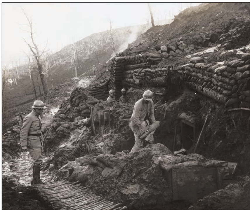
Verdun, chargement d'un «crapouillot» au lieu-dit «Le ravin de la mort» (0.084x0.099) Décembre 1915 Les-Eparges, Verdun. Inv. 2005.29.7

Le modèle 58 n° 2 reste le plus répandu dans les tranchées françaises. Sa bombe à ailettes, en drap garance, devient l'insigne des artilleurs de tranchée, corps dont le général Joffre préconise la création dès le 16 février 1915. L'artillerie en profite pour envoyer ses fortes têtes partager la vie des fantassins dans les tranchées, d'où la réputation frondeuse attachée aux «crapouillots».