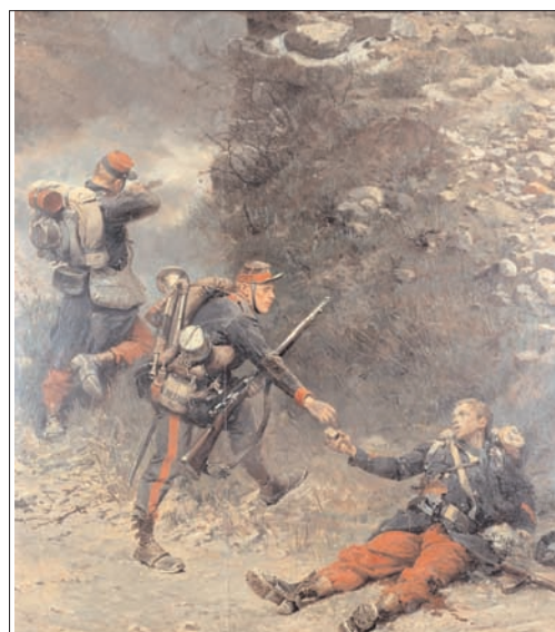
Le fond de la giberne, Huile sur toile (293x259 cm), 1882 A. de Neuville, E. Detaille. Inv. 5239 ; Eb 311

La bataille de Champigny se déroule du 30 novembre au 3 décembre 1870 ; elle doit desserrer l'étau allemand autour de Paris. Le panorama représente l'attaque allemande du 2 décembre et la réaction française marquée par la reprise des positions perdues, notamment le four à chaux de Champigny. Le fond de la giberne met en scène, dans un chemin creux, un fantassin blessé, mourant, remettant ses dernières cartouches à un clairon de mobiles.