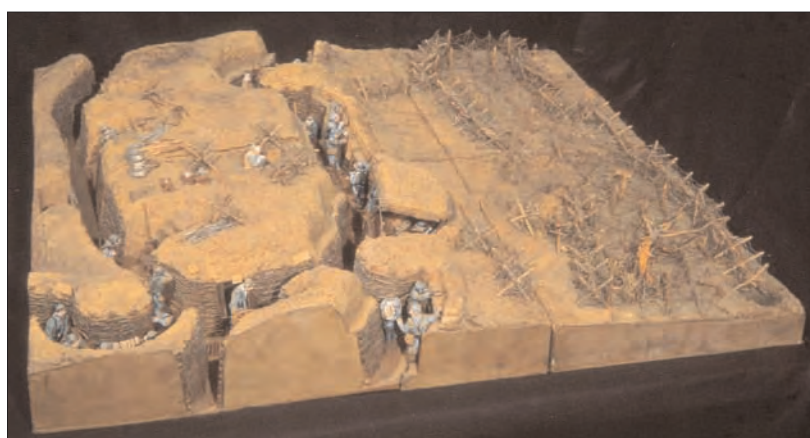
Maquette d'une tranchée française.

Une tranchée est composée de plusieurs lignes distantes de quelques centaines de mètres, reliées par des «boyaux» sinueux pour éviter les tirs d'enfilades. Elle est creusée à une profondeur d'environ 2 mètres et surmontée d'un parapet élevé avec des sacs de sable. Des excavations servent d'abris aux hommes et aux munitions, une casemate abrite le nid de la mitrailleuse. Ici, des fascines consolident les parois et des rondins de bois recouvrent le sol.