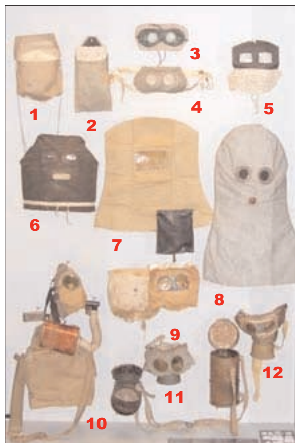
Salle des "poilus", localisation des objets de la vitrine.

Ces dispositifs de compresses et de lunettes sont néanmoins longs à attacher ; les lunettes souffrent du manque d'étanchéité ou de la buée qui rend la vision impossible. Le masque TNH (5) est plus rapide à mettre en place mais ne résout pas tous ces problèmes. Les cagoules (6, 7 et 8) sont plus pratiques et efficaces, mais étouffent leur porteur ; en sus, elles ne suivent pas le mouvement de la tête et réduisent énormément le champ de vision ; seule la cagoule «Hypo» anglaise (8) est satisfaisante. Le masque M2 (9), très efficace, était lui aussi pénible à porter, le soldat devant inspirer et expirer au travers de compresses épaisses. Face à ces défauts et à la multiplication des types de gaz, on développe des masques couvrant le visage, dotés d'une cartouche filtrante en tôle contenant des produits neutralisant les gaz, et des filtres, notamment