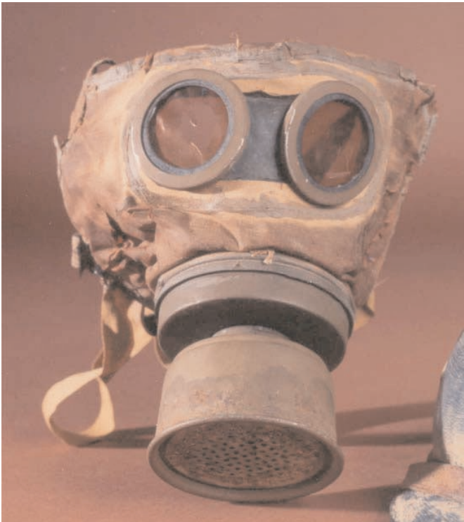
Appareil Normal de Respiration modèle 1917, France.

La première utilisation de gaz au combat est une initiative allemande. La chimie est un domaine d'excellence de la recherche et de l'industrie allemande ; elle s'appuie sur une production houillère en constante augmentation depuis 1871. Le gaz asphyxiant utilisé en avril 1915 est à base de chlore. Cet après-midi du 22 avril, à 17 heures, les poilus voient s'élever des tranchées allemandes, d'étranges nuages verdâtres ; ils pensent un instant que la tranchée allemande est en feu mais au lieu de s'élever, ces nuages glissent lentement en tourbillonnant au ras du sol pour former une grande nappe blanche qu'un vent léger pousse vers les Français. La vague, en abordant la tranchée française, répand une forte odeur de javel et tous les occupants sont saisis par un mal extraordinaire qui bloque la respiration, provoque la nausée et fait défaillir. En trois quarts d'heure, sur six kilomètres de front, cette attaque coûte 5 000 morts, 15 000 intoxiqués ou blessés. Ce gaz doit être inhalé pour produire son effet ; de plus, il est fugace et se dissipe rapidement ; l'emploi d'un masque à gaz se révèle donc assez efficace pour s'en protéger.