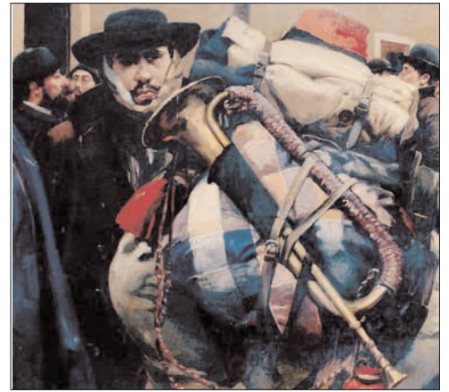
Les réservistes (détail), Pierre-Georges Jeanniot, huile sur toile (114x194 cm) Inv. 05247 ; Eb 402

La III e République, en instaurant l'école obligatoire et le service militaire, a assuré à la France une cohésion nationale qui révélera toute sa profondeur pendant les épreuves de la Première Guerre mondiale.