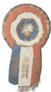
Cocarde de conscrit Inv. 25542

La III e République, tirant les leçons de la défaite de 1871, fait le choix d'une armée de conscription. Il faut attendre les lois de 1889 et 1905 pour que se généralise vraiment le service militaire des jeunes Français.