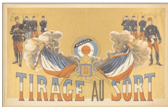
«Bon de tirage au sort». Bulletin de conscrit. Inv. 2006.10.95

Les bons de tirage au sort et la cocarde font partie du folklore populaire qui entoure le service militaire quand celui-ci devient obligatoire. Les jeunes gens de 19 ans révolus se présentent au conseil de révision de leur canton où ils passent notamment une visite médicale. Chaque jeune homme inscrit reçoit un numéro au hasard. Jusqu'en 1889, la loi prévoit un tirage au sort : les «mauvais numéros» correspondent au service long, cinq ans, les «bons numéros» au service court, un an. D'autres sont exemptés.