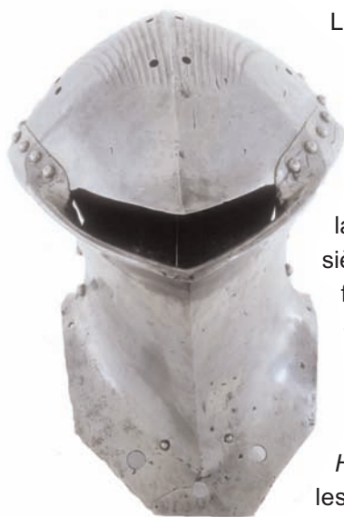
heaume "crapaud" Inv. G 528

Le musée de l'Armée présente en toile de fond la reproduction agrandie d'une planche de Hans Burgkmair extraite du Livre du Triomphe (1516-1519) de l'empereur Maximilien I er . On y voit des cavaliers équipés pour l'une des variantes du Gestech , le Hohenzeuggestech ; les hommes sont revêtus du « heaume-crapaud » et de lourdes armures ; les lances sont terminées par un bréchet tripode ou un fer émoussé ; les chevaux sont protégés d'une grande hourt (matelassure recouvrant l'encolure du cheval).