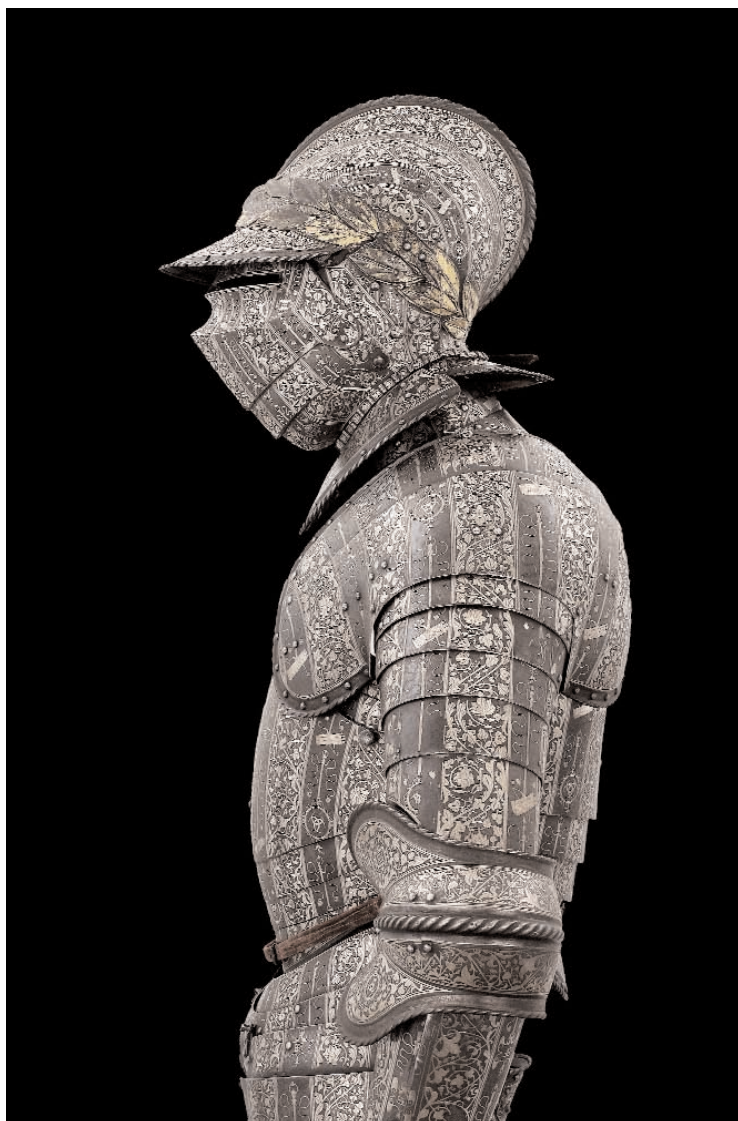
"Armure du dauphin". Inv. G 118

Quant à Filippo (vers 1510-1579) et Francesco Negroli (vers 1522-1600), auteurs de plusieurs armures destinées à Charles Quint, ils se sont vraisemblablement partagés la réalisation de «l'armure du dauphin». On peut cependant estimer que c'est à Francesco Negroli, spécialisé dans le travail de la damasquine, qu'en revient la plus grande part.