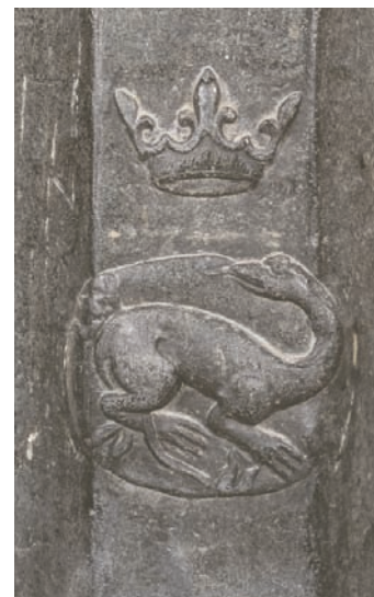
Couleuvrine (détail). Inv. N83.

Ces couleuvrines aux armes de François I er et de Charles Quint rappellent l'affrontement entre le roi de France et l'empereur germanique pour le contrôle du Milanais, région stratégique qui assure la liaison entre l'Espagne et la Franche-Comté espagnole, mais achève d'encercler la France.