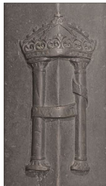
Couleuvrine (détail). Inv. N569