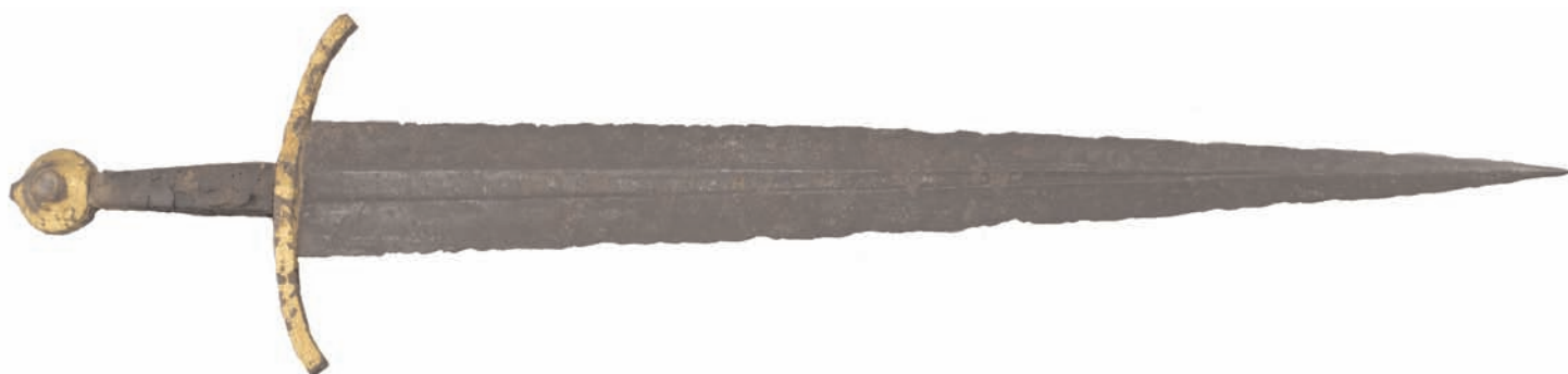
Épée d'armes. Inv.J Po 678 07-515454

L'ensemble de l'arme, d'une exécution parfaite et aux lignes très pures, peut être daté du XIV e siècle. L'épée était mise dans un fourreau de cuir pendu à une ceinture sur le surcot d'étoffe couvrant la cotte de mailles.