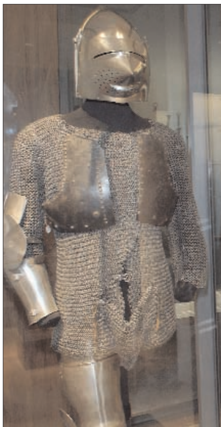
Le haubert de mailles et de plates.