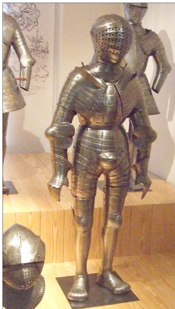
Armure pour le combat à pied. Inv. : G 178

Le harnois G 178 (vitrine 32-2) est issu de l'atelier milanais de Niccolo Silva vers 1510 (la marque de l'armurier apparaît à quatre reprises : sur le colletin, les cuissards et l'épaulière). Réalisé en fer forgé, ciselé, gravé et doré, ce harnois mesure 1,70 m de hauteur et 0,70 m de large. Il est conçu selon le style allemand des armures de joutes à pied assurant la protection complète du corps. La saignée des bras, les aisselles et l'arrière des genoux sont recouverts par des lames de fer. Les reins sont étroitement enserrés dans des sortes de chausses, également travaillées dans le métal. L'armet, au timbre hémisphérique, est complété d'un mézail à ventail percé de trous assurant la visibilité. Il se place dans la gorge de la lame supérieure du colletin fixé par de fortes vis au plastron. Les épaulières sont symétriques et articulées de huit lames. Le plastron, s'agrandissant en son centre, est maintenu latéralement à la dossière par une charnière. La braconnière s'allonge, épousant les formes du bassin, et s'adapte aux cuissards. Elle est complétée, à l'entre-cuisse, d'une brayette triangulaire. Les solerets* sont à patte d'ours. Un motif floral est visible sur les genouillères. La majorité des pièces sont animées d'un décor de taillades en creux, réparties géométriquement et gravées de rinceaux dorés. L'ornementation est destinée à recréer l'aspect des vêtements d'apparat du XVI e siècle car l'armure est réalisée en fonction des modes civiles.