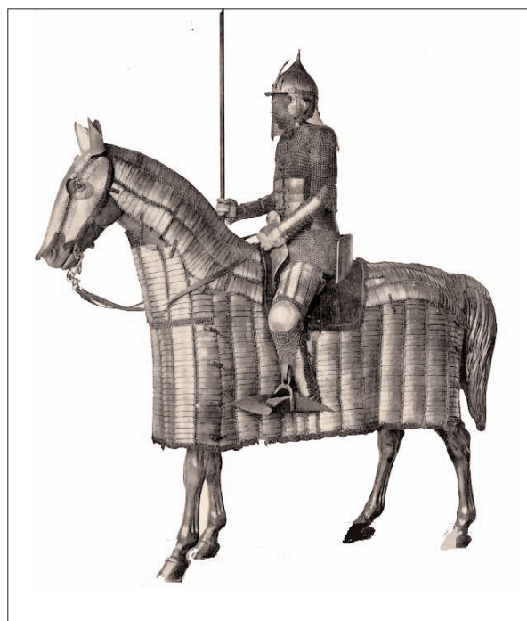
Barde, selle et armure de cavalier mamelouk. Inv. G 717-G 555

L'équipement défensif de l'armée ottomane repose, du XIII e au XVII e siècle, sur l'emploi de l'armure complète en cotte de mailles (appelée «jazeran») renforcée par des plaques métalliques sur le torse ; ces protections permettant d'allier légèreté et souplesse étaient connues dès l'antiquité. A cette armure, on ajoutait des protections indépendantes pour les jambes et les bras. Ainsi, le mannequin porte une paire de cuissards renforcée par des genouillères en métal plein, une paire de brassards et une paire de jambières ; toutes ces protections sont renforcées par des lamelles métalliques articulées insérées dans la cotte de mailles. La défense de tête présentée est la protection ottomane classique depuis le XIV e siècle. Elle présente un timbre en forme de bulbe orné de cannelures et est destinée à être portée