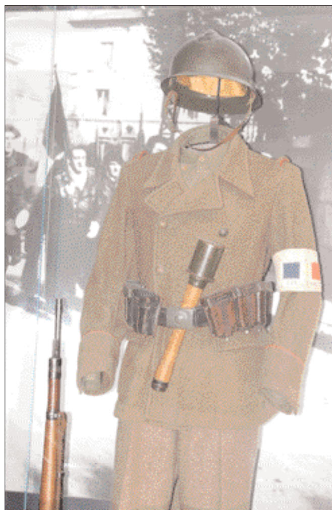
Maquisard FFI en Provence, inv. Ga 528.

En mai 1944, de Gaulle nomme le général Koenig, le héros de Bir-Hakeim, commandant en chef des FFI. Ce commandement français de la Résistance est reconnu par les Alliés. Toutefois, ces derniers sont réticents à armer ces forces. Les