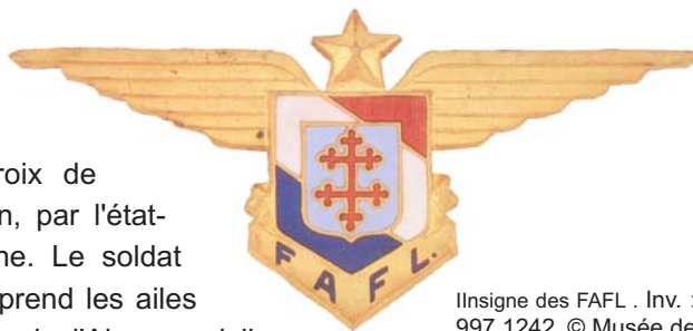
Insigne des FAFL. Inv. 997 1242.