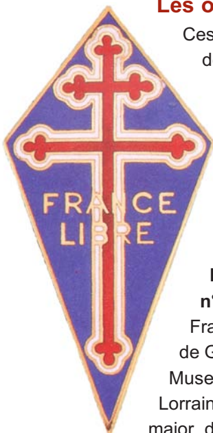
Insigne des FNFL. Inv. : 999 563.

Ces trois insignes reconnus par l'état-major de Londres sont numérotés selon l'ordre du ralliement de leur détenteur à la France Libre. Ils se portent sur le côté gauche de la poitrine (côté cœur). (Les combattants peuvent aussi porter des insignes d'unité reprenant le nom de leur bâtiment, de leur escadrille ou de leur unité d'affectation.)