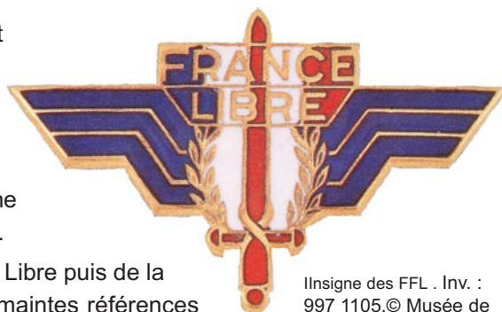
Insigne des FFL. Inv. : 997 1105.

Forces Françaises Libres n° 317 - Les premiers volontaires FFL portent une bande brodée «France», un peu comme celles des troupes du Commonwealth qui mentionnent leur territoire d'origine. En décembre 1940, le caporal Louvier dessine pour les FFL, sur un cahier d'écolier (ce qui explique les proportions de l'objet), cet insigne surnommé «le moustique». Le glaive est entouré des ailes de la victoire et de la couronne de laurier. Il reprend les trois couleurs nationales et la mention France Libre.