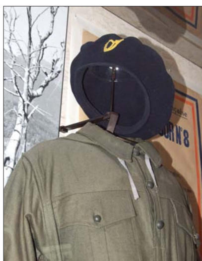
Volontaire du 159 e régiment d'infanterie alpine, front des Alpes, 1944-1945. Inv. Ga 535.

Ce soldat du 159 e régiment d'infanterie Alpine fait partie des 190 000 volontaires, la plupart issus de la Résistance, qui ont rejoint les armées de la Libération à partir de juillet 1944.