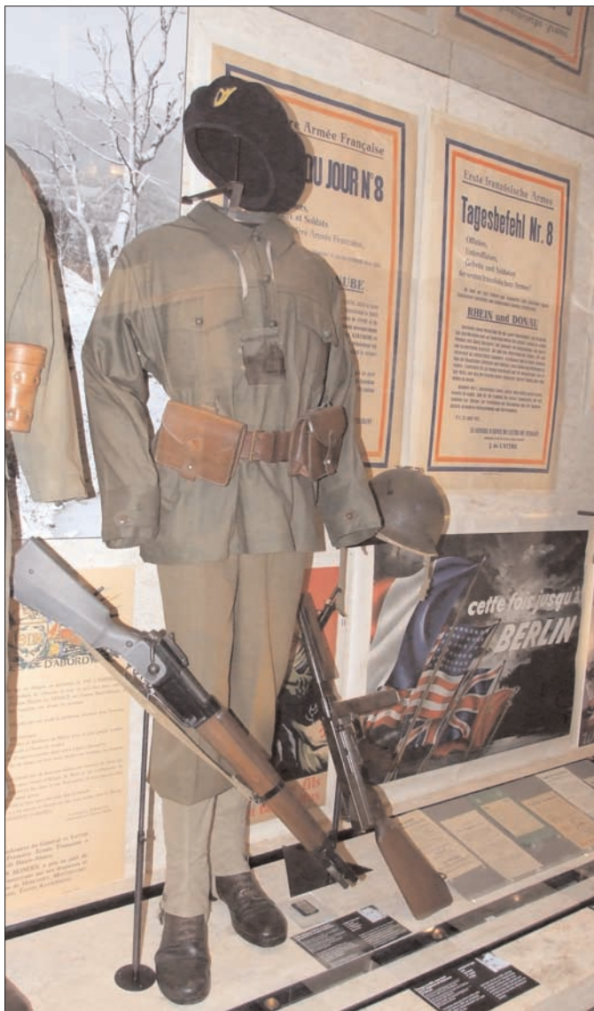
Volontaire du 159 e régiment d'infanterie alpine, front des Alpes, 1944-1945. Inv. Ga 535.

nombreuses formations, en Bretagne, dans le sud-est et dans les Alpes, mal équipées et peu armées, harcèlent les unités allemandes qui se replient ou rejoignent spontanément les armées françaises, notamment la 1 ère Armée. La situation déjà confuse risque d'empirer à cause d'une tentative de soulèvement révolutionnaire menée par le COMAC, une émanation du parti communiste qui voit les FFI comme le noyau d'une armée populaire. La réponse est gaullienne : «Tous les soldats de France font partie de l'armée française et celle-ci, comme la France, reste une et indivisible» . Les décrets du 19 et 20 septembre fixent l'organisation et le statut des FFI qui, faisant partie intégrante de l'armée, sont soumises aux règles de la discipline militaire et relèvent de la seule autorité du ministre de la Guerre 1 . Les volontaires doivent signer un engagement pour la durée de la guerre. Les grades FFI, déjà acquis, doivent être homologués par une commission. Les étrangers qui souhaitent s'engager le font dans la Légion étrangère.