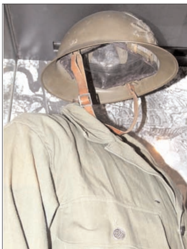
Artilleur du Corps Expéditionnaire Français en Italie. Inv. : Ga532

Le CEF qui participe à la campagne d'Italie, en 1943, représente une étape importante de la refondation d'une armée française destinée à la libération du territoire. Cette armée remise en condition avec l'appui des Américains réunit 2 composantes ayant pris des options divergentes dès 1940 : les FFL et l'armée d'Afrique.