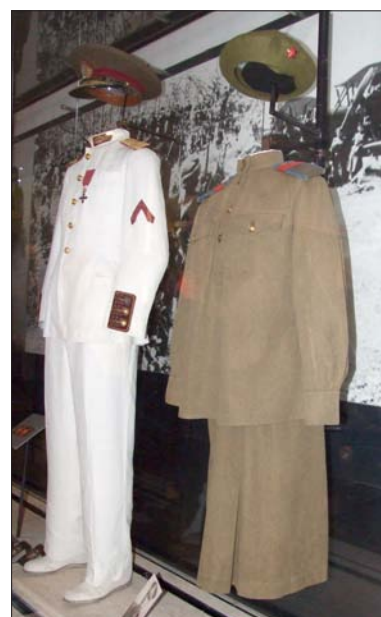
Uniforme de femme russe. Inv. GF46.

Le recrutement féminin, en temps de guerre, dans les usines et les armées, permet de réserver plus d'hommes au champ de bataille. A l'exception de l'Union soviétique, ces femmes sont recrutées sur la base du volontariat et signent un engagement pour la durée de la guerre. Elles ont un statut d'auxiliaire, différent de celui des militaires (par exemple, elle ne porte pas d'arme, elle ne sont pas encasernées...). Elles sont affectées à des postes administratifs et techniques qui utilisent une formation professionnelle déjà