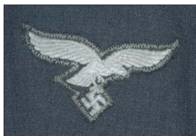
Uniforme d'auxiliaire féminine des transmissions de la Luftwaffe (détail). Inv. GF 45.

Pendant la Première Guerre mondiale, les femmes sont sollicitées pour participer à l'effort de guerre et renforcer les services sanitaires. Avant même le début de la Seconde Guerre mondiale, tirant les leçons du conflit précédent, des pays belligérants les intègrent pour la première fois au sein des armées en guerre.