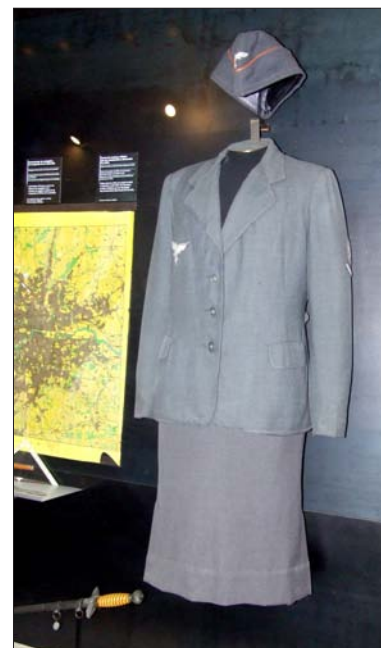
Uniforme d'auxiliaire féminine des transmissions de la Luftwaffe. Inv. GF 45.

Le musée expose plusieurs uniformes féminins. D'une manière générale ces tenues sont une adaptation des uniformes masculins. Elles reprennent les matériaux, les insignes. Les WAFF ( Women Auxiliary Air Force ) britanniques se distinguent par une casquette exclusivement féminine (vitrine 3 e étage 07C). Les jupes sont généralement droites avec ou sans pli d'aisance.