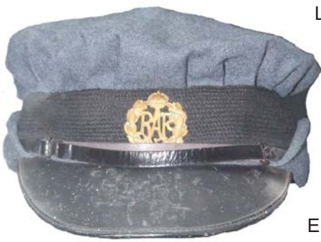
Casquette d'une WAFF. Inv. Ha 62.

L'uniforme d'auxiliaire féminine des transmissions de la Luftwaffe se compose d'une veste, d'une jupe droite et d'un calot en drap gris-bleu. Le drap gris bleu et la coiffure sont identiques pour l'ensemble de la Luftwaffe. L'emblème, un aigle volant tenant dans ses serres une croix gammée, est brodé sur le bonnet de police et la jaquette. L'insigne de spécialité et le chevron simple posés sur la manche gauche de la veste indiquent qu'il s'agit d'une téléphoniste confirmée.