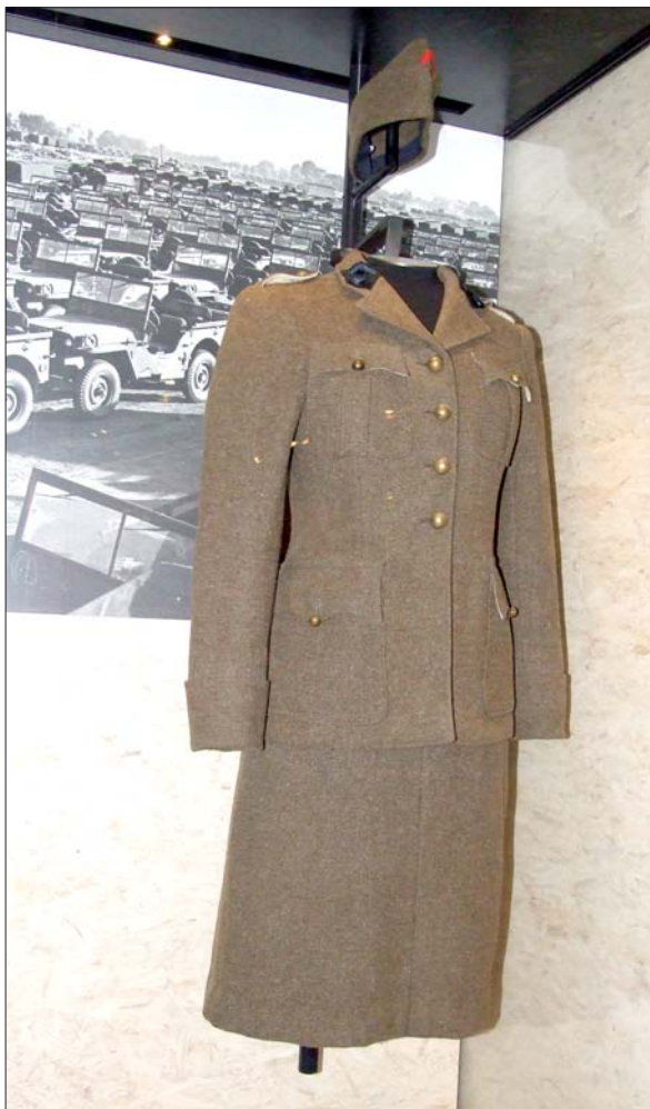
Uniforme de "merlinette". Inv. : 31190 © Musée de l'Armée.

acquise dans le civil ou des aptitudes physiques plus particulières aux femmes. Elles ne sont pas sensées aller au feu, à l'exception, là encore, des unités soviétiques.