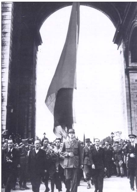
Photographie : le général de Gaulle descend les Champs-Élysées (26 août 1944)

La libération de Paris (25-26 août 1944) constitue une étape majeure de la libération de la France. Par delà ses aspects militaires, l'événement comporte aussi une dimension politique décisive pour le général de Gaulle et le gouvernement provisoire qu'il préside.