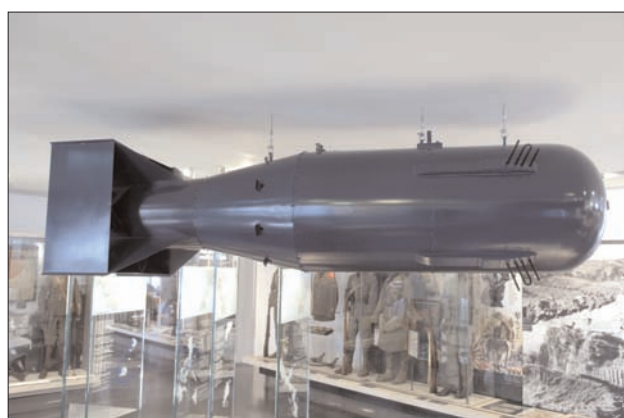
Maquette à l'échelle 1 de Little boy , bombe à l'uranium 235 lancée sur Hiroshima le 6 août 1945.

Le Musée de l'Armée expose une reproduction de la première bombe atomique lancée contre un objectif en temps de guerre. Elle est larguée sur la ville japonaise d'Hiroshima, par les États-Unis, le 6 août 1945.