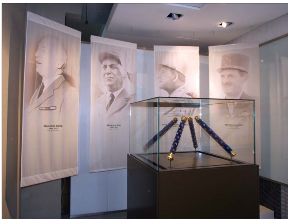
Les maréchaux de la Seconde Guerre mondiale

A la suite de l'ordonnance du 19 août 1836, les 7 étoiles deviennent, avec le bâton, le symbole du maréchalat 1 . Cette dignité n'est pas un grade bien qu'elle ne soit conférée qu'à titre militaire, à un officier général ayant commandé victorieusement une armée en temps de guerre.