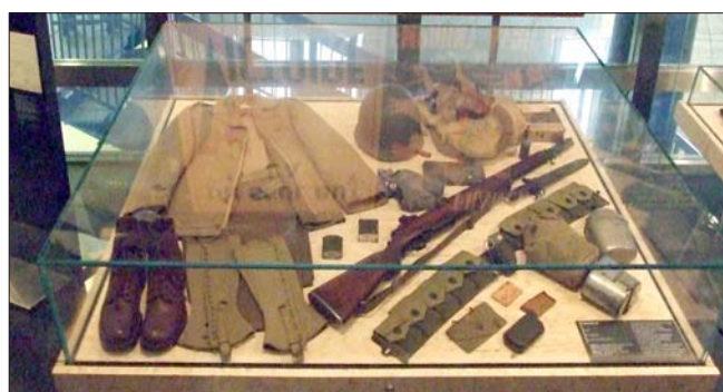
Détail du paquetage US. Inv. : 999.1535 © Musée de l'Armée

Alimentation : rations alimentaires de type K Breakfast-Dinner-Supper (conditionnées dans des boîtes de conserve enveloppées dans du papier paraffiné, elles peuvent être consommées dans les pires conditions atmosphériques), couverts (fourchette, couteau, cuillère), réchaud transportable (utilisant de l'alcool solidifié), bouteille de Coca-Cola,