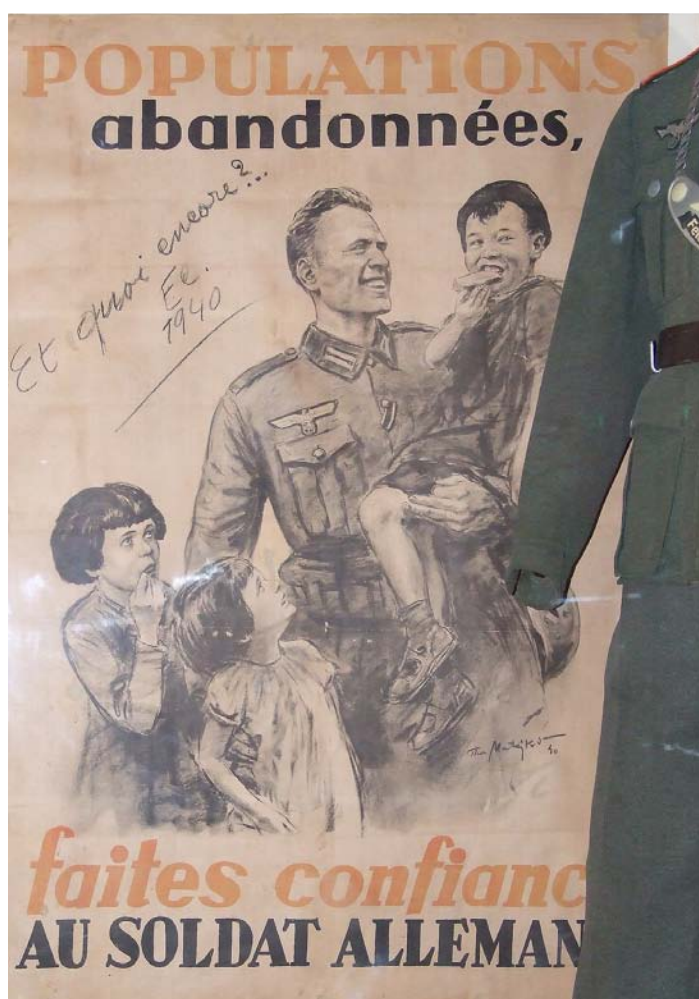
Affiche de propagande allemande, 1940 (facsimile). Inv. 02G47