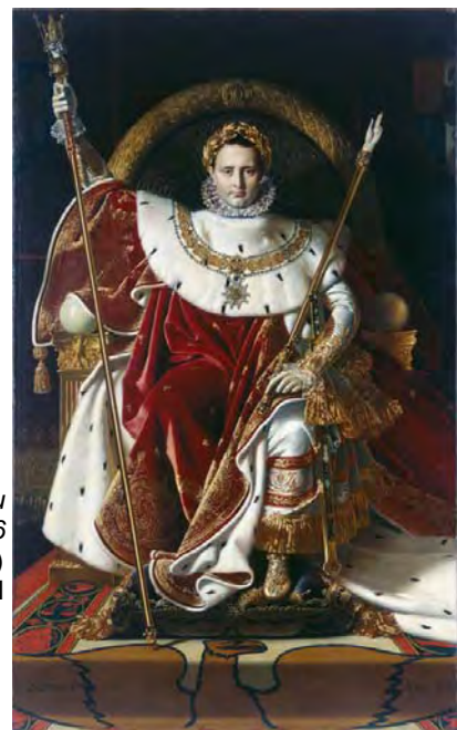
Napoléon Ier sur le trône impérial ou Sa majesté l'empereur des Français sur son trône, 1806 Jean-Auguste Dominique Ingres (1780-1867)