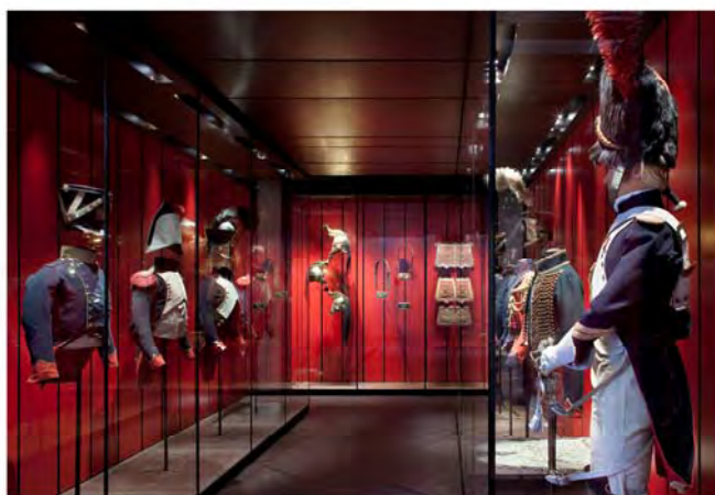
Musée de l'Armée - Département Moderne Repérages Architecture, architectes et muséographes, mandataire