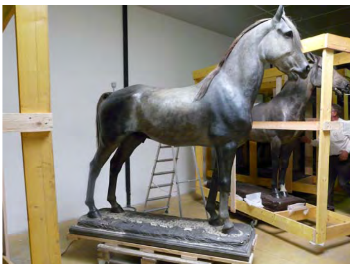
Stockage des chevaux en perspective de leur restauration

La restauration a débuté par un nettoyage. Les crinières, fabriquées avec des scalpés de vrais chevaux et fixés par de petits clous, ont été brossées, micro-aspirées, peignées. Sur les robes, les accidents ont été repris formellement, puis on a procédé à une retouche colorée et à un rééquilibrage des niveaux de couleur afin d'homogénéiser l'ensemble une fois les chevaux harnachés.