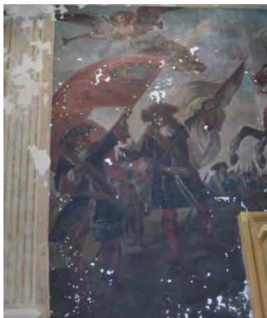
Salle Vauban - Peintures murales en cours de restauration < Mur sud (entrée) Mur ouest >

Le mur des fenêtres, extrêmement lacunaire par endroit, a été traité de façon archéologique, c'est-à-dire que de grandes lacunes ont été laissées volontairement apparentes. On peut voir au fond de ces lacunes la belle préparation rouge du XVIIe s.. Une teinte neutre modulée, à l'aquarelle, a été passée sur les lacunes profondes de pierre, pour les intégrer au décor existant.