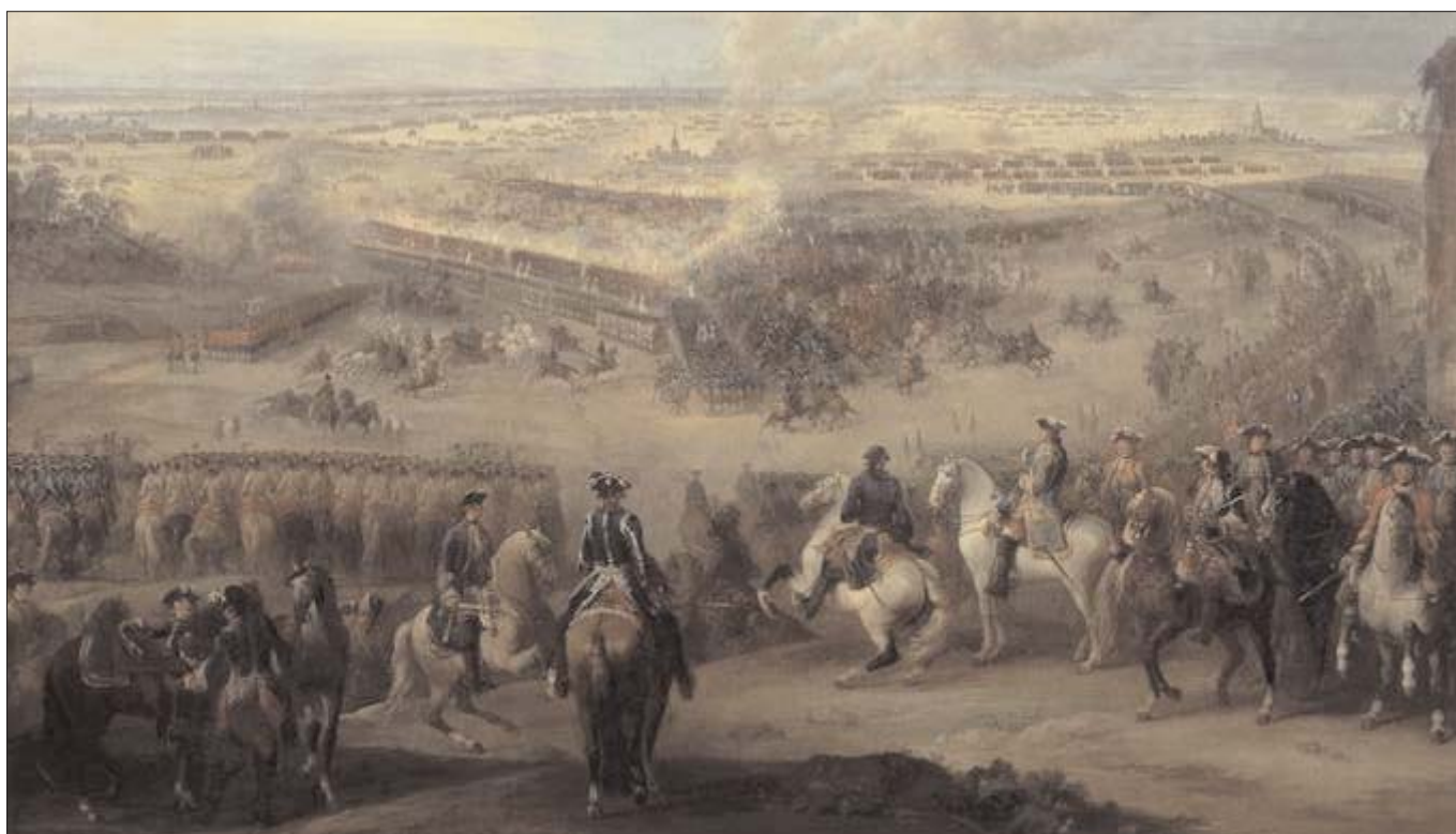
La Bataille de Fontenoy, 11 mai 1745 : Louis XV accompagné du dauphin, donnant des ordres au maréchal de Saxe, Pierre Lenfant (1704-1787). Inv. 22146 ; Eb 1527.

La bataille de Fontenoy, livrée en présence du roi Louis XV, le 11 mai 1745, constitue l'une des plus grandes victoires des troupes françaises en bataille rangée sous l'Ancien Régime (un plan-relief animé présente le déroulement de cette bataille).