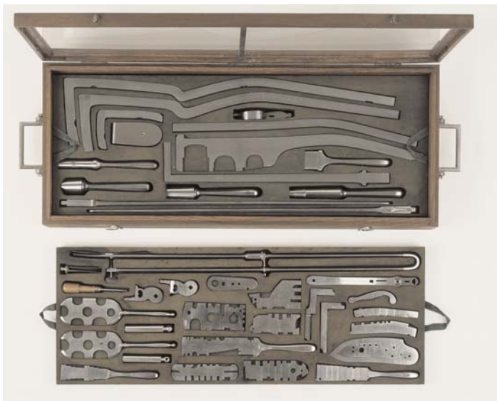
Nécessaire de vérification pour le fusil modèle 1777. Inv. 88057/P108.

Le fusil de 1777 se caractérise par son exceptionnelle longévité. Équipant progressivement les troupes à la fin de l'Ancien Régime, il reste en service sans modifications majeures jusque sous la Monarchie de Juillet. Il subit des transformations plus importantes dans les années 1840 et 1850 : conversion de la platine à silex en système à percussion, introduction de rayures à l'intérieur du canon (permettant une précision plus grande et une portée accrue). Après ces transformations, certains exemplaires demeurent encore en usage dans l'armée française jusqu'au conflit franco-prussien de 1870-1871.