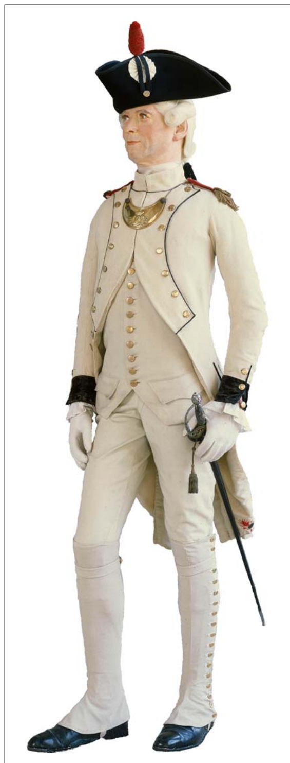
Capitaine de grenadiers, régiment de Neustrie, 1786. Inv. 7073 ; 2004.16.5 ; Ga 7.

Jusqu'au XVII e siècle, la tenue uniforme signale les serviteurs des grandes maisons qui reçoivent une livrée aux couleurs de leur maître. Les combattants portent des vêtements civils sur lesquels ils superposent des défenses de corps et pour certaines troupes réglées des casaques à la couleur du roi ou du prince qu'elles servent.