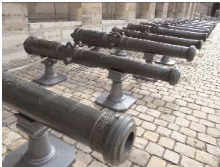
Batterie de canons dans la cour d'honneur.

Le canon classique français est désormais possible de caler solidement la pièce sur un affût. Déplacement et pointage gagnent alors en rapidité et accroissent sensiblement l'efficacité de l'arme. En outre, le second renfort est pourvu d'anses de manutention, le plus souvent figuratives, qui facilitent la manipulation du tube. Un canon de bronze de calibre 12, mesure en moyenne 3,450 m, pèse environ une tonne et demie et envoie un boulet de douze livres (soit environ 6 kg). Le canon classique est décliné en 5 calibres : les calibres 4 et 8 pour l'artillerie de campagne, les calibres 16 et 24 pour l'artillerie de siège. Le canon de calibre de 12, à la jonction entre petits et grands calibres est utilisé aussi bien dans les batailles en plat pays que pour la défense des places fortes.