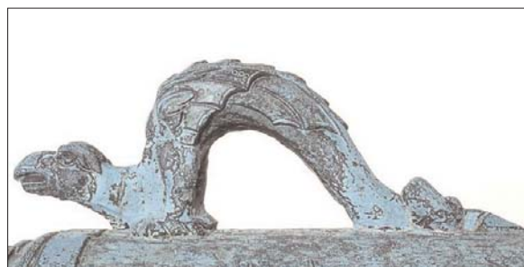
Anse du canon de 16, la Curiosité. Inv. N103.

menée par Louis XIV s'oriente davantage vers la guerre de siège pour enlever les places fortes destinées à protéger «le pré carré» du royaume. Cependant le rôle de l'artillerie s'affirme également dans les batailles : à Malplaquet (1709), l'artillerie française n'oppose que 80 canons aux 100 à 120 canons de la coalition adverse. En raison de l'efficacité des tirs de leur artillerie, les Français déplorent deux fois moins de pertes que leurs ennemis.