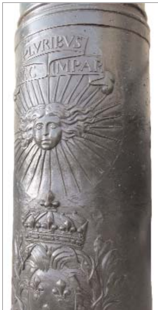
Décor du canon de 12, le Solide . Inv. : N10.

En 1666, Louvois, secrétaire d'État de la Guerre, décide de moderniser l'artillerie française et lance un vaste appel d'offres auprès des fondeurs européens. Après étude, le projet des frères Keller, originaires de Zurich, est retenu. Ce projet propose la fabrication d'un canon aux proportions et à l'ornementation harmonisées. Les artisans helvétiques installent leur fonderie à Douai. Instrument du prestige royal, le canon classique français illustre de façon remarquable la place de la guerre dans le système absolutiste. Pendant la première partie de son règne, deux grands capitaines mènent les armées du roi : Turenne et le grand Condé. Après la mort de Turenne en 1675 et la retraite, la même année, du prince de Condé, «la guerre de cabinet»