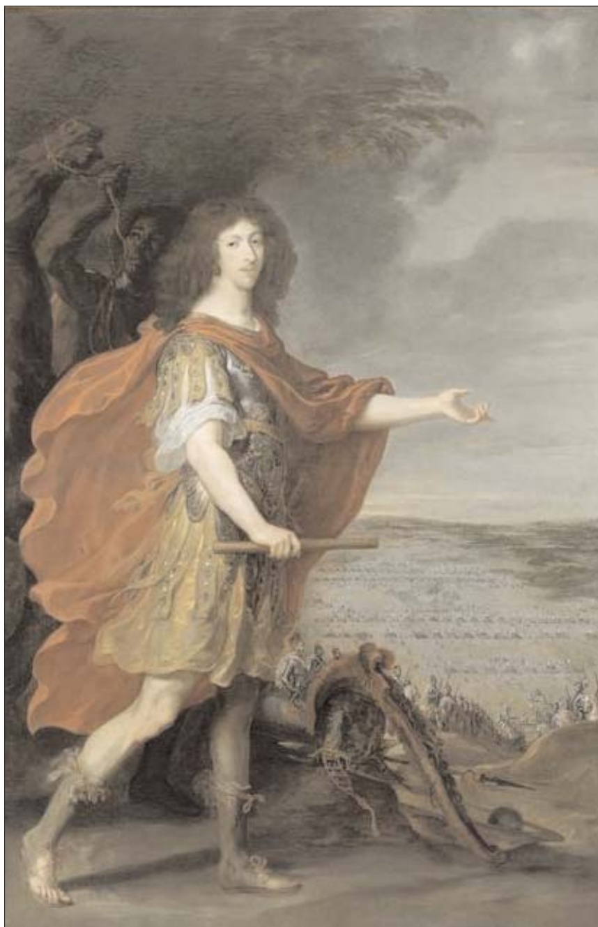
Louis II de Bourbon (1621-1686), devant le champ de bataille de Rocroi, Van Egmont Justus (1601-1674), 164 Inv. 2007.31.1.