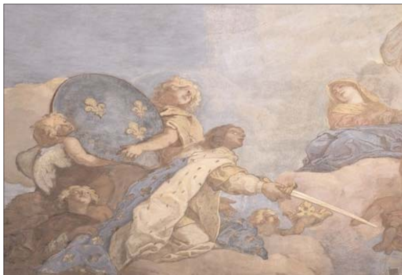
Décor de la coupole supérieure de l'église Saint-Louis des Invalides : détail, saint Louis présente ses armes au Christ.

L'œuvre de Charles de La Fosse représente saint Louis dans la gloire, présentant ses armes au Christ en présence de la Vierge et des anges. Au centre de cette voûte céleste, Dieu et la Vierge sont entourés d'anges musiciens. Saint Louis