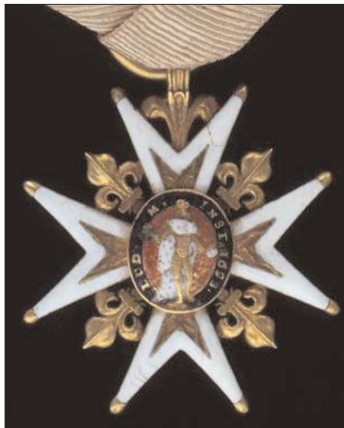
Croix de chevalier de l'ordre de Saint-Louis, règne de Louis XVI (1774-1792). Inv. 03039 ; Ka 293.1

Les médaillons des deux épées ne correspondent pas à un ordre chevaleresque ou de mérite.