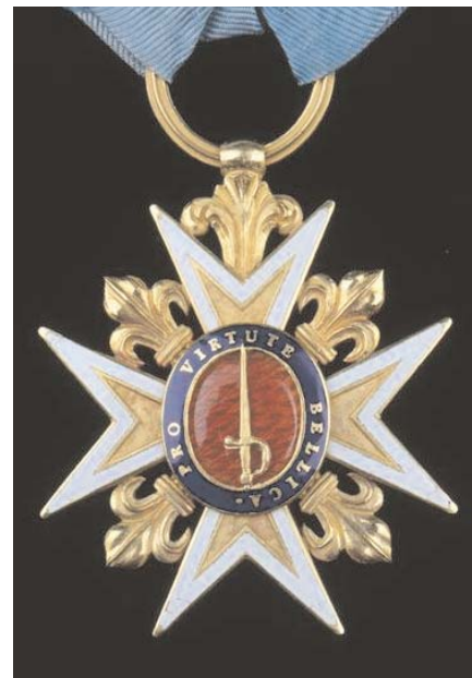
Croix de chevalier de l'ordre du Mérite militaire, règne de Louis XV (1723-1774) Inv. 995.230 ; Ka.