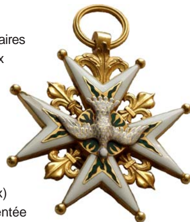
Croix de chevalier de l'ordre du Saint-Esprit. Inv. : 21723.

Les ordres de mérite, créés par Louis XIV et Louis XV conservent la même forme de croix, à quatre branches et fleurs de lys. La médaille de Saint-Louis, en or émaillée de