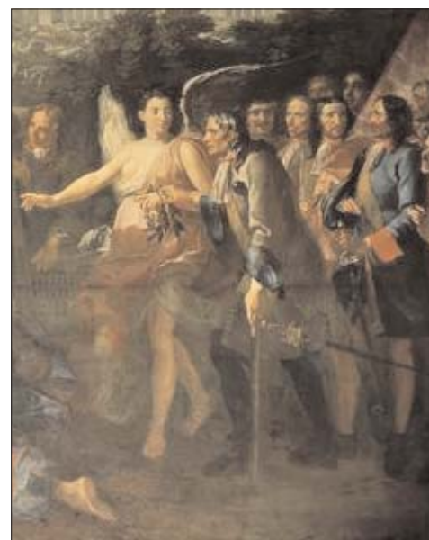
Les premiers invalides guidés par une Victoire arrivent à l'Hôtel .