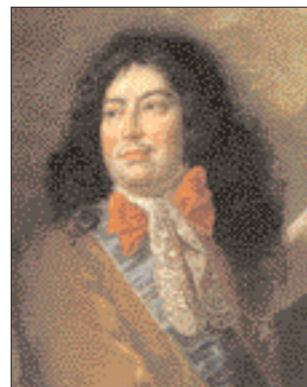
François-Michel Le Tellier, marquis de Louvois (1641-1691).

Au centre du tableau figure le marquis de Louvois accompagné de Minerve, déesse de la sagesse et de la guerre. Le ministre, assisté de l'Architecture agenouillée, présente au roi le plan des bâtiments dont la construction est en cours à l'arrière-plan. Le souverain est accompagné de son frère, Monsieur, à sa droite, et de trois grands chefs militaires, disparus à l'époque où le tableau fut peint : le maréchal de Luxembourg, derrière lui, Turenne et le Grand Condé plus à gauche.