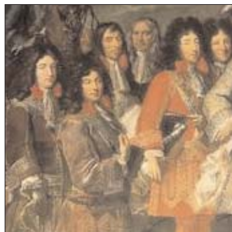
Le maréchal de Luxembourg, Turenne et le Grand Condé.

En avant, on reconnaît les deux architectes de l'édifice, Libéral Bruant et Jules Hardouin-Mansart. À droite, une Victoire conduit vers le roi un groupe de soldats invalides. Dans le ciel vole la Renommée, tenant une oriflamme et sonnant de sa trompette pour proclamer au monde la gloire du souverain.