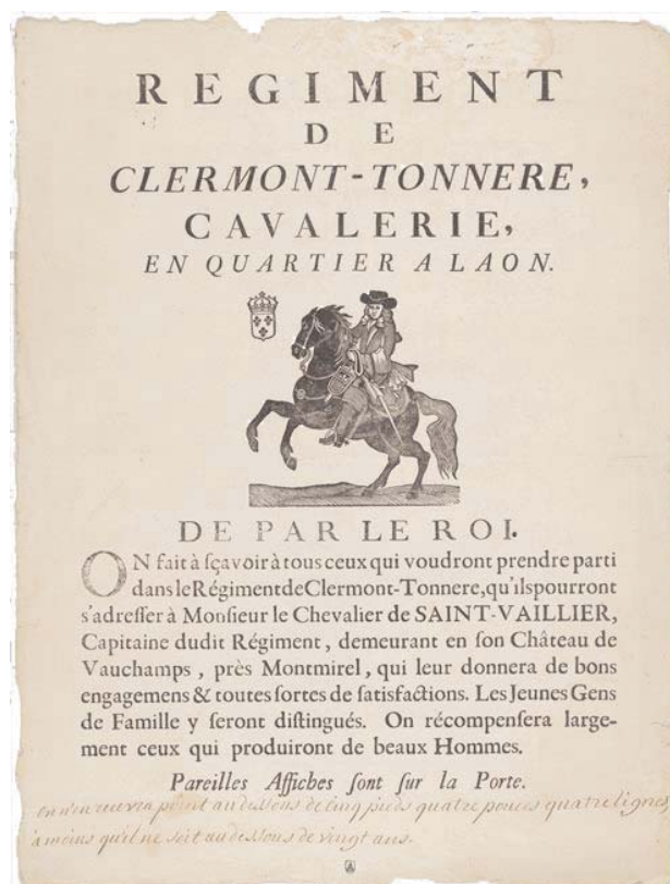
Affiche de recrutement pour le régiment de Clermont-Tonnerre, v. 1709-1713. Inv. 998.341.