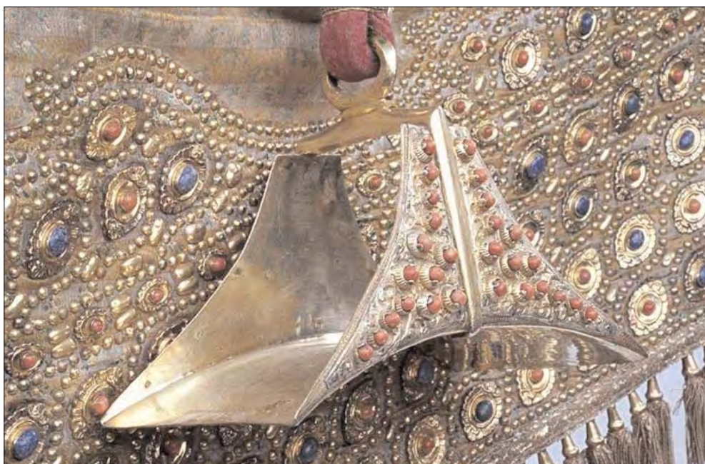
Harnachement de Mamelouk (détail).

Le 1 er août 1798, la destruction de la flotte française en rade d'Aboukir par l'amiral Nelson, laisse l'armée de Bonaparte prisonnière de sa conquête. En 1799, les Français se battent en Syrie contre les troupes ottomanes. Le 25 juillet de la même année, de retour en Egypte, Bonaparte défait les janissaires* turcs à Aboukir. Il rentre en France au mois d'octobre, laissant le commandement de l'armée à Kléber qui sera assassiné par un fanatique, en 1800, au Caire. Son successeur, le général Menou, ayant négocié un armistice avec les Britanniques, les dernières troupes françaises quittent l'Égypte à la fin de l'année 1801. En dépit de son échec final, la campagne égyptienne donne au général corse le prestige et l'assurance nécessaires au coup d'État du 18 Brumaire an VIII (9 novembre 1799).