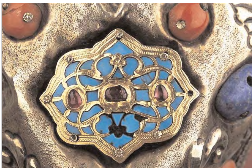
Harnachement de Mamelouk (détail).

Mamelouk, forme passive du verbe arabe « malka », signifie «possédé». Esclaves des Ottomans originaires des Balkans et d'Europe centrale, les Mamelouks sont islamisés, entraînés au métier des armes puis affranchis. Véritable institution militaire remontant au XIII e siècle, les Mamelouks assurent alors la protection de l'Islam contre les Mongols et les Croisés. Les autorités ottomanes leur confient le contrôle de l'Égypte, province de l'Empire. Peu appréciés des Égyptiens en raison de leur propension au brigandage, ils forment des principautés quasi-indépendantes de l'autorité turque. Deux de leurs chefs, Ibrahim bey et Mourad bey, furent