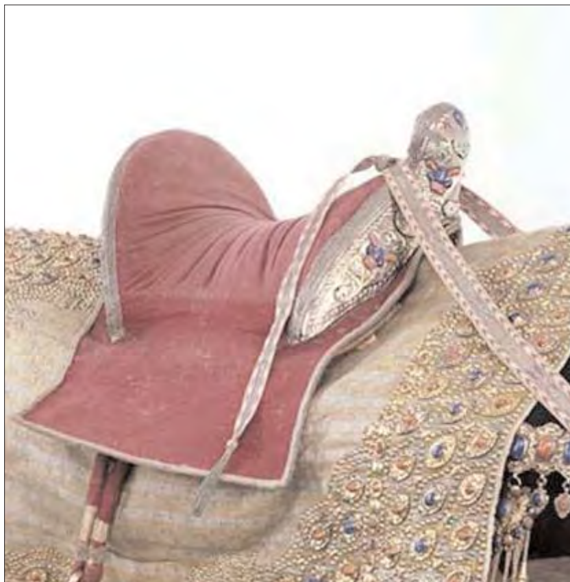
Harnachement de Mamelouk recueilli sur le champ de bataille des Pyramides. Inv. 5169 I ; Cd 71.