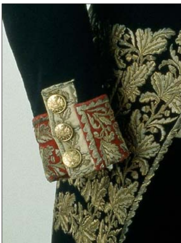
Habit (détail)

Marengo est une victoire collective remportée in extremis et qui ne met pas un terme à la guerre contre l'Autriche. La décision finale est remportée par Moreau à Hohenlinden, en décembre. Cependant la propagande du Premier Consul présente Marengo comme la réussite de l'homme providentiel qui change le cours des choses. À Paris, la liesse populaire éclate à l'annonce de la victoire. Les corps constitués rendent visite à Joséphine qui les reçoit, tenant à la main une branche de laurier d'or détachée d'un drapeau ennemi. Le retour du Premier Consul est triomphal. Son pouvoir politique est renforcé face aux opposants politiques et aux généraux jaloux de son ascension.