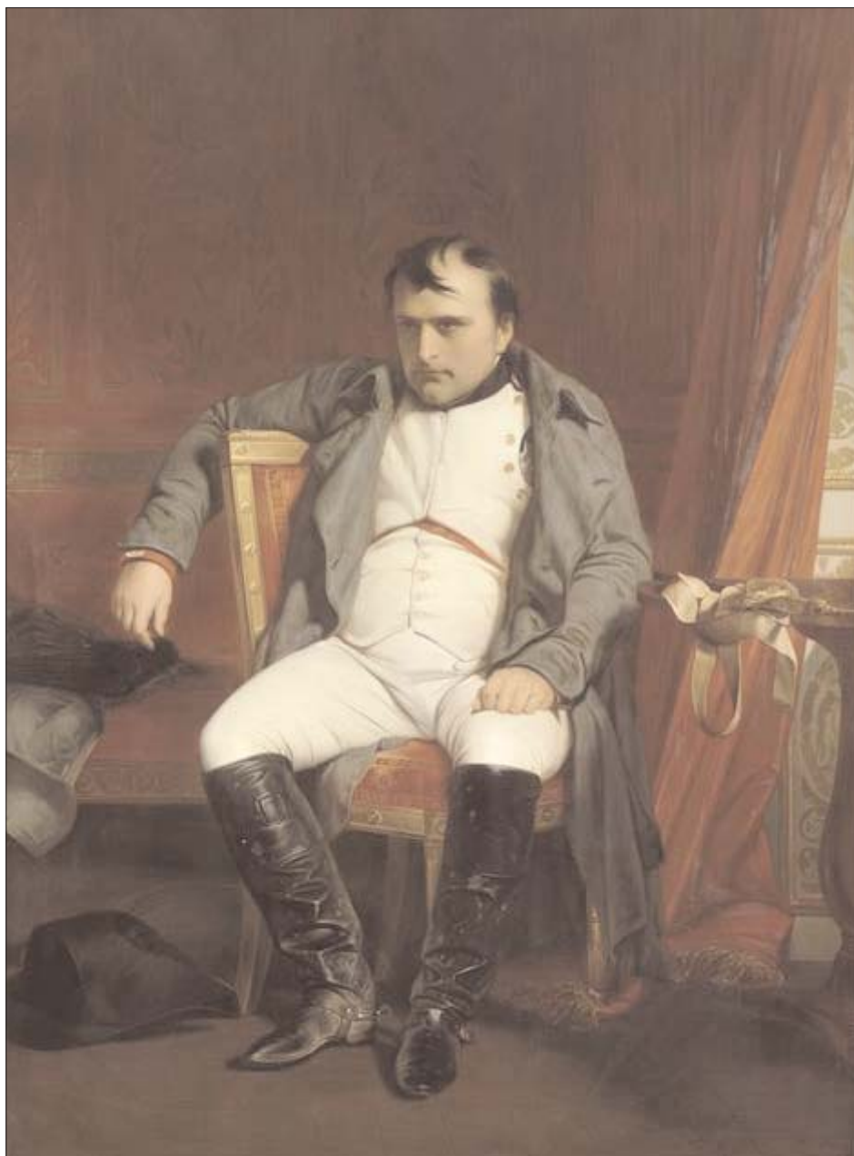
Napoléon I er à Fontainebleau, le 31 mars 1814, peint par Paul Delaroche en 1840. Inv. 11931 ; Ea 90.1.

Œuvre pathétique, la toile de Delaroche exprime la solitude et la détresse de l'Empereur à quelques jours de sa chute. Le tableau illustre un extrait des Mémoires de Bourienne : «Après avoir passé une partie de la nuit à Froidmanteau, l'Empereur se dirigea vers Fontainebleau où il arriva à six heures du matin. Il ne fit pas ouvrir les grands appartements, et se campa plutôt qu'il ne se logea dans le petit appartement qu'il affectionnait. Napoléon s'enferma dans son cabinet et y resta seul pendant la journée du 31 mars 1814.» .