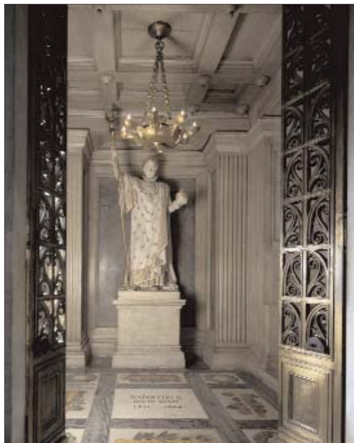
Statue de Napoléon I er, Pierre-Charles Simart (1806-1857).

Aux Invalides, Simart est également l'auteur des dix hauts-reliefs qui ornent le déambulatoire de la crypte impériale. Ils retracent les grandes réalisations du Premier Consul puis de l'Empereur, celles qui refondent la société française en lui assurant certains acquis de la Révolution.