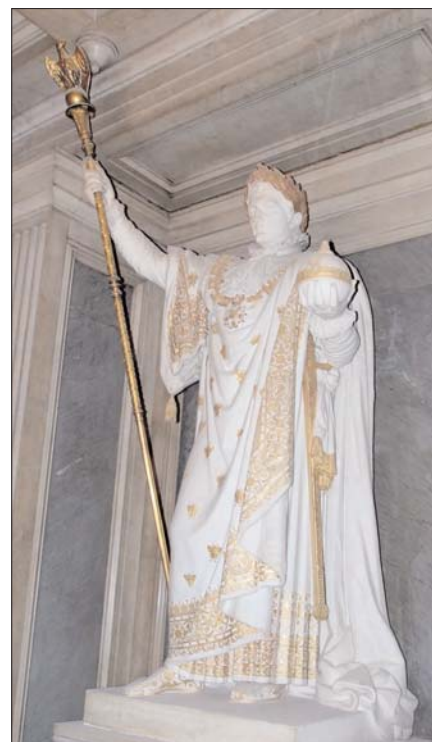
Statue de Napoléon I er en costume de sacre par Pierre-Charles Simart (1806-1857), située dans la cella.

Le 2 décembre 1804, Napoléon Bonaparte est sacré Empereur des Français dans la cathédrale Notre-Dame, en présence du pape Pie VII. En bien des points (succession héréditaire, autorité centrale forte, création d'une noblesse d'Empire, ordre de chevalerie et maréchalat, fastes des cérémonies du sacre), le régime impérial se rapproche de la monarchie défunte. Cependant la symbolique retenue pour les regalia du sacre marque sa différence en reliant le nouvel Empire à la Rome antique et à l'Empire fondé par Charlemagne.