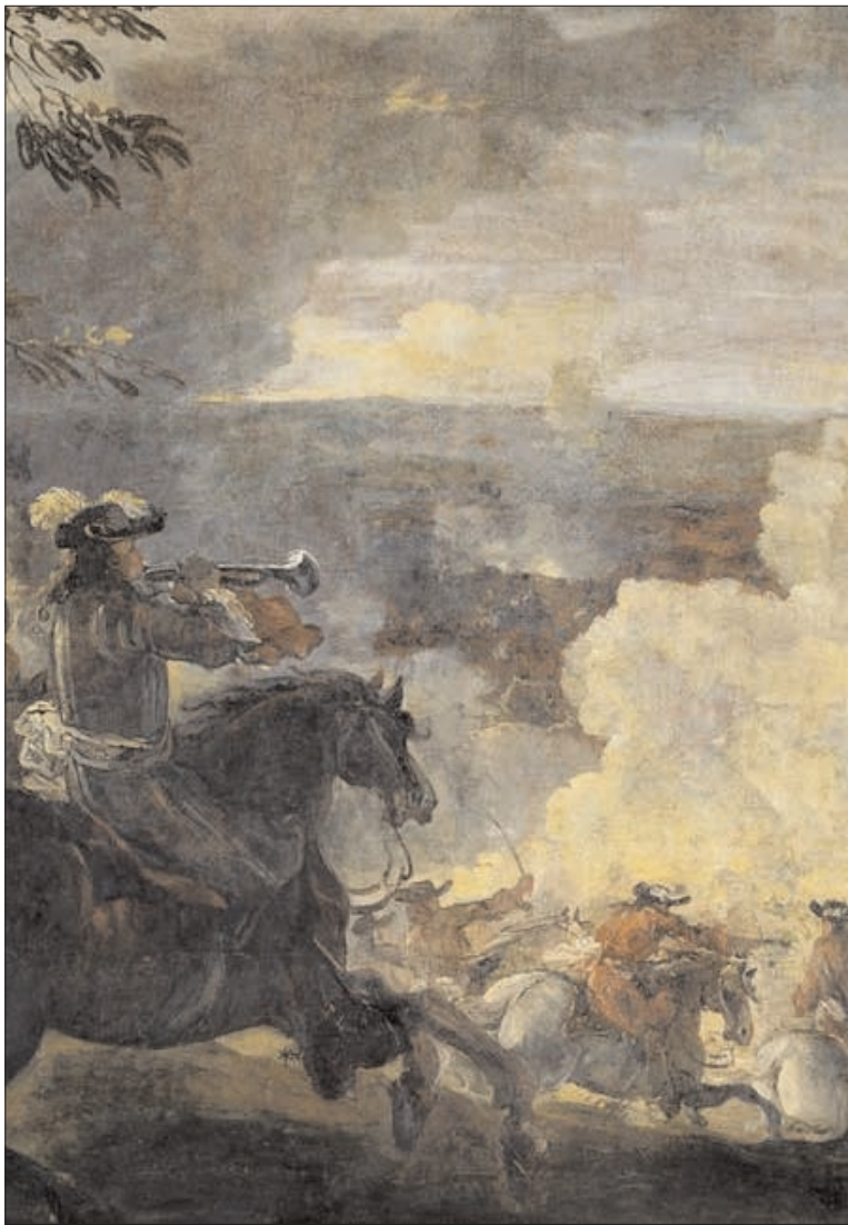
Bataille de Saint-Denis - devant - Mons, le 14 avril 1678

les résidences royales par Le Brun et son entourage, il travaille aux Invalides de 1679 à 1681. Ce premier chantier lui permet de se faire connaître du roi qui lui commande, après la semi-disgrâce de Le Brun en 1683, une suite de tableaux de batailles pour décorer la salle des Gardes et la première antichambre de son nouvel appartement de Versailles.