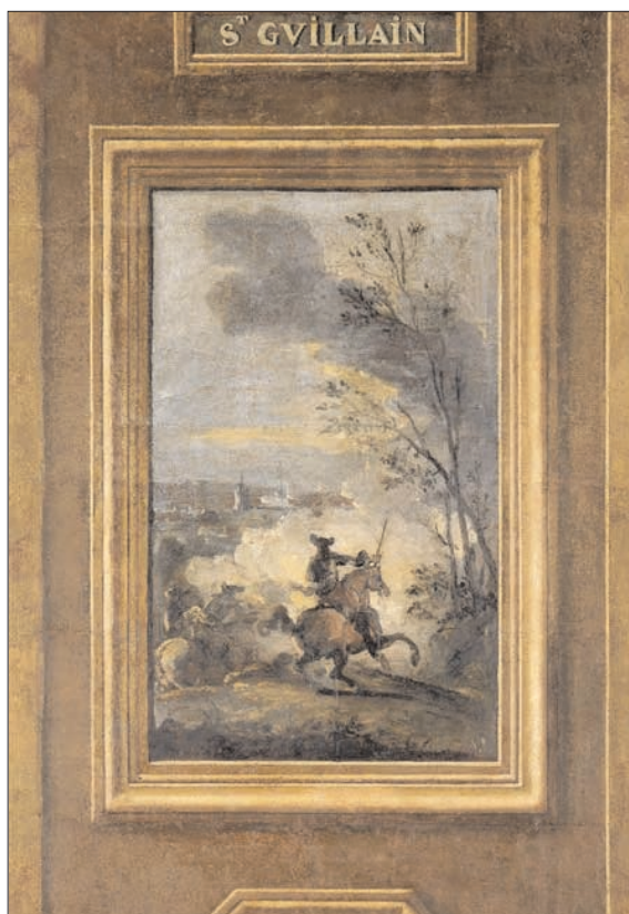
La prise de Saint-Ghislain, le 11 décembre 1677

Le mur Ouest, percé de onze fenêtres, reproduit en vis-à-vis la disposition du mur Est. La restauration de 2005 a fait apparaître une alternance de grandes compositions et de trumeaux. Les scènes de batailles embrassent les fenêtres ; sur les trumeaux, des tableaux en trompe-l'œil sont encadrés par des pilastres peints, aux chapiteaux et aux bases sculptés.