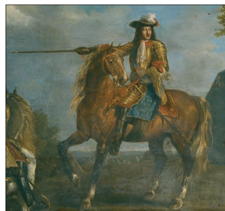
Portrait de Louis XIV © Musée de l'Armée/RMN 05-53394.

Le mur Est, aveugle, présente une suite de cinq grandes compositions rappelant des scènes de batailles et de sièges de villes : Valenciennes, Cambray, Maastricht, Cassel et Gand. Cette suite est rythmée par des trumeaux* architecturaux.