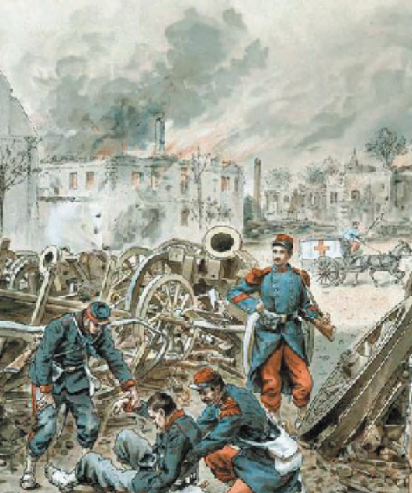
Planche extraite de « Guerre de 1870. Le siège de Strasbourg » de Gustave Fisbach, 1897, d'après Émile Schweitzer © Paris - Musée de l'Armée / RMN.