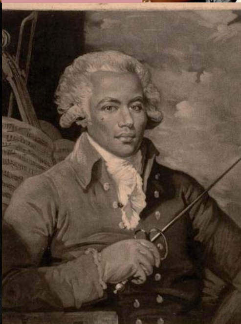
MONSIEUR DE S t GEORGE.